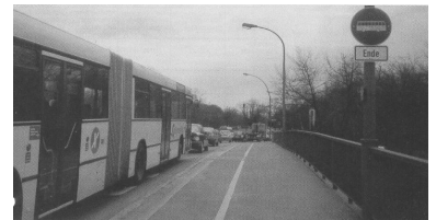
BVG-ExpressBus X 26 im Stau auf der Nördlichen-Seestraßen-Brücke, weil die Busspur zu früh endet. Daß der seit dem 17. Dezember verkehrende ExpressBus - dank der Politik der Herren Haase und Schmitt - eher ein «Im-Stau-Steh-Bus» werden könnte, ahnte die BVG bereits Monate zuvor: «Nur partiell Busspuren, extreme zeitliche Begrenzung» beklagte sie in dem untenstehenden internen Papier.