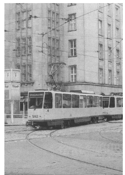
Chaussee- Ecke Invalidenstraße. Aussetzfahrt der modernisierten Tram nach der ersten Fahrgastfahrt.