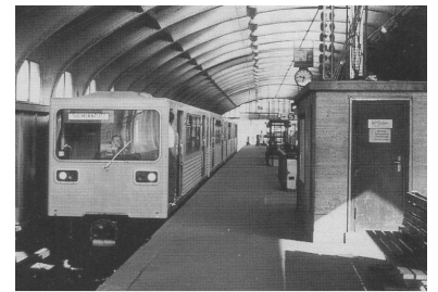
GI-Zug im Oktober 1982 auf dem U-Bf Schönhauser Allee. Bis ihr Einsatz im West-Netz möglich wurde, vergingen jedoch noch über 10 Jahre. Seither waren sie allerdings einer anhaltenden Rufmordkampagne ausgesetzt. Die als "Ost-Ware" diffamierten Züge wurden für das mehrmonatige Durcheinander im BVG-Kleinprofilnetz verantwortlich gemacht - zu unrecht.

"Die technische Störanfälligkeit... hatten die Züge auch schon bei dem bisherigen Einsatz auf dem nördlichen Teil. Das zeigt der hohe Bestand von 226 Wagen, bei 12 Umläufen mit 8-Wagen-Zügen - also mehr als hundert Prozent Reserve." (BVG-Signal