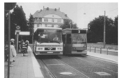
Gemeinsame Trasse und Haltestelle von (Niederflur-)Tram und Bus - auch hierbei ist Kassel ein Vorbild für Berlin.