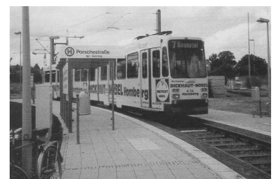
Seit Mai 1994 ist die 1,5 km lange Neubaustrecke bis zur provisorischen Endstelle Porschestraße in Baunatal in Betrieb. An dem 3 km langen Verlängerungsabschnitt nach Baunatal-Großenritte wird bereits kräftig gearbeitet, da dieser im Mai 1995 eröffnet werden soll.