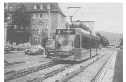
Bauen unter Betrieb ist in Kassel und vielen anderen Städten eine Selbstverständlichkeit. «Das würde uns viel zu viel Geld kosten, extra einen Schienenersatzverkehr einzurichten», meint KVG-Vorstand Prof. Meyfahrt zum Thema SEV. Und dies gilt auch für die hier abgebildete Kasseler Hauptmagistrale Wilhelmshöher Allee.