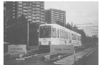
So einfach kann eine Endstelle aussehen, wenn Zweirichtungsfahrzeuge eingesetzt werden. Diese neu eingerichtete Endstelle Helleböhn ist aber nur ein Zwischenstop auf der im nächsten Jahr in Betrieb gehenden Verlängerung nach Süden Richtung Oberwehren.

Das veränderte Marketing in Kassel läßt sich an einigen Zahlen deutlich ablesen. Durch das neue Angebot ab 1985 wurden zunächst kaum neue Fahrgäste gewonnen. 1987/88 mußte auf Druck der Stadt das Angebot an einigen Stellen sogar wieder zurückgenommen werden, während aber die Marketing-Anstrengungen verstärkt wurden. Fahrgastbefragungen brachten dann das Ergebnis, daß in der Meinung der Fahrgäste der Nahverkehr besser geworden sei. Seit 1990 habe die KVG auf diesem Wege die Fahrgastzahlen um 15% steigern können.