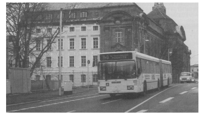
Immer wieder haben Moabiter Ratschlag und Fahrgastbeirat Tiergarten auf die Notwendigkeit einer verbesserten Busanbindung im Huttenkiez hingewiesen. Nun soll ab Juni 1996 die Ost-West-Buslinie 340 wenigstens während der Hauptverkehrszeit über Turmstraße, Beusselstraße und Kaiserin-Augusta-Allee zum Mierendorffplatz verlängert werden.