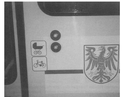
Was in Potsdam möglich ist, wird von der BVG für die (fast) baugleiche Berliner Straßenbahnzüge untersagt: Der Umweltverkehrsverbund ÖPNV + Fahrrad.