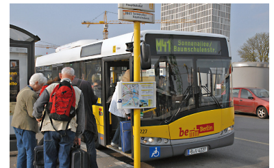
Endlich gibt es im wachsenden Berlin auch Angebotsausweitungen bei der BVG, auf mehreren Buslinien bereits ab 27. April.

Auf den Linien 120, 220, 256, 269 und 309 werden die Betriebszeiten verlängert. Beim 136er gibt es neu im Früh- und Spätberufsverkehr den 5-min-Takt zwischen