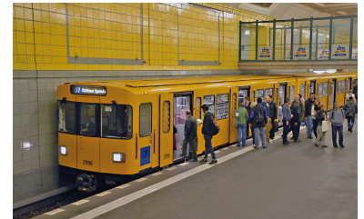
Auf mehreren U-Bahn-Linien ab 24. August 2014. Auch das Straßenbahnangebot wird verbessert.