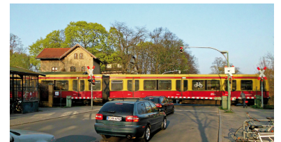
Bahnübergang am S-Bahnhof Lichtenrade.