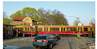
Bahnübergang am S-Bahnhof Lichtenrade.