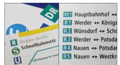
R und RE im VBB-Atlas 1994 und 1993