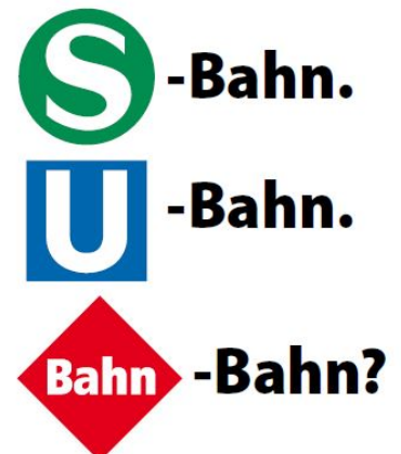
Signets können erklären und nicht Fragen aufwerfen. Eine Bahn-Bahn ist sinnlos. (Abb: VBB)