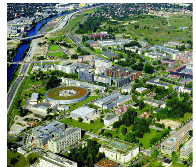
Wissenschaftsstadt Adlershof. Während der Autobahnanschluss frühzeitig realisiert wurde, fehlt die Straßenbahnbindung zum Bahnhof Schöneweide. Doch die Fahrgäste dürfen hoffen, denn die Nutzen-Kosten-Untersuchung für die Straßenbahndurchbindung brachte ein äußerst positives Ergebnis.