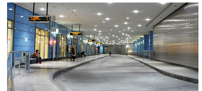
Der Busbahnhof im »Kreisel« genannten Hochhaus am S+U-Bf Rathaus Steglitz ist verwaist. Die Zufahrt ist für Busse gesperrt, weil sich die BVG (Eigentümer des darunter liegenden U-Bahnhofs) und der Privat-Eigentümer des Hochhauses nicht einigen können, wer eine möglicherweise sanierungsbedürftige Betondecke des BVG-Tunnels/Fußbodenuntergrund des Busbahnhofs reparieren soll oder darf.

Für einen überschaubaren Übergangszeitraum wären die Erschwernisse für Fahrgäste vielleicht noch hinnehmbar gewesen. Da dieser Zustand aber auf unabsehbare Zeit andauern wird, muss eine fahrgastfreundlichere Regelung gefunden werden. Der Fahrgastverband IGEB schlägt daher vor, dass der beim Ausbau des Busbahnhofs im