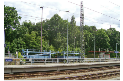
Arbeitslos in Wannsee: Die rollenden Verladerrampen haben ausgedient. Nach Berlin kommt kein Autozug mehr. Zu teuer sind die Transportwagen, zu gering ist der Ertrag.

Diese Flexibilisierung ist zwar ein guter Gedanke der Bahn, aber wegen der Beschränkung auf zwei, drei ausgewählte Alternativzüge nur halbherzig umgesetzt. Diese starre Festlegung ist unnötig. Ferner besteht die Problematik, dass außer dem Nachtreisezug CityNightLine keiner z. B. am Verladebahnhof in Berlin-Wannsee hält.