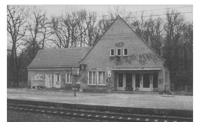
Völlig verfallend sind die Bahnhöfe Schönwalde (Kr Nauen) und Falkenhagen (Kr Nauen) auf dem Berliner Außenring. Mit dem Fahrplanwechsel am 2. Juni wird hier kein Zug mehr halten. Zwar liegen die Bahnhöfe abseits der Siedlungen, aber für Ausflüger aus dem nahen Berlin sind sie als Ausgangspunkt von Fuß- oder Radwanderungen gut geeignet.