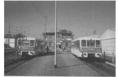
Neustadt (Dosse) ist ein klassischer Verknüpfungspunkt im Rahmen eines Integralen Taktfahrplanes. Hier steigen die Fahrgäste von der Hauptbahn (künftige RE 2) in die Nebenbahnen nach Rathenow (RB 50) und Neuruppin (RB 53) - siehe Bild - sowie nach Pritzwalk (RB 73) um. Manko: Umsteiger müssen durch einen verfallenen Tunnel oder 300 m über eine Schranke und eine belebte Straße gehen. Umbauten sind erst 1997 zu erwarten.

Zu erkennen ist heute schon, daß sich um die Lausitz-Metropole Cottbus praktisch sternförmig ein Vorortverkehr herausbildet: Sechs jeweils zweistündliche RegionalBahn-Linien nach Lübbenau (Spreewald), Finsterwalde (Niederlausitz) -