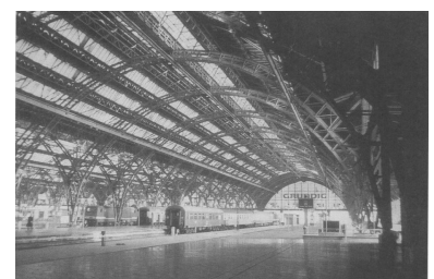
Leipzig Hbf. Auf der Ausbaustrecke Berlin - Halle/Leipzig sind die Arbeiten für das VDE Nr. 8 am weitesten vorangeschritten