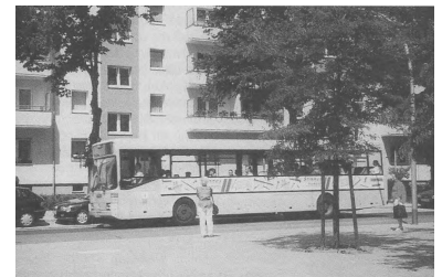
Die neue Omnibuslinie 256, mit der große Erschließungslücken im Bezirk Hohenschönhausen beseitigt und eine wichtige neue Querverbindung nach Lichtenberg hergestellt werden konnten, wurde schon in den ersten Betriebstagen von den Fahrgästen rege frequentiert.