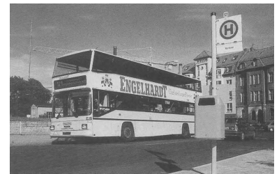
Die OL 121 wurde zum Fahrplanwechsel vom Märkischen Viertel über Rosenthal und Nordend bis zum Ossietzkyplatz verlängert.