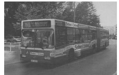
Endstelle U-Bf Wilmersdorfer Straße der seit dem Fahrplanwechsel am 2. Juni verkehrenden neuen ExpressBuslinie X49.

Westlich der Havel gab es neben der ExpressBuslinie X49 noch eine weitere