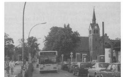
Eine neue Tangentialverbindung wurde mit der Verlängerung der Omnibuslinie 259 von Malchow über den Blankenburger Pflasterweg, S-Bf Blankenburg nach Buchholz, Kirche geschaffen.