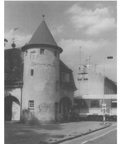
Ausgewählt für das Modulprojekt Bürger-Bahnhof: Der Bahnhof Rheinsberger Tor in Neuruppin.

Das Gebäude befindet sich - abgesehen von Putzschäden und Graffiti im