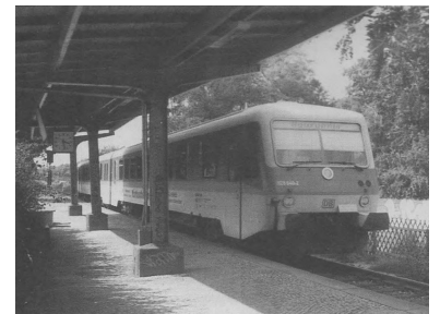
Auf dem Bahnhof Neuruppin Rheinsberger Tor.