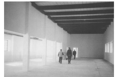
Das Foto zeigt die Räume des Berliner S-Bahn-Museums noch ohne die hier in der Zwischenzeit angesammelten Ausstellungsstücke.

Als die Sammlung der Vereine, unterstützt durch Private, immer größer wurde, entstand der Wunsch, diese Exponate einer breiteren Öffentlichkeit zeigen zu können. Die Museums-Idee war geboren. Doch es fehlten Räume, um den ständig wachsenden Ausstellungsfundus öffentlich und dauerhaft zeigen zu können. Mit den neuen Räumen im Umspannwerk Griebnitzsee besteht nun erstmals die Möglichkeit, die Idee Wirklichkeit werden zu lassen, d.h., - die bisher schon angehäuften "Schätze" endlich in einem dafür geeigneten Raum der Öffentlichkeit zugänglich zu machen, vielen noch verborgenen Schätzen privater Sammler eine Ausstellungsmöglichkeit zu geben, die Aktivitäten anderer zu ergänzen und schließlich mehr als die bisher nur wenigen Mitarbeiter zum Auf- und Ausbau der Sammlung zu gewinnen.