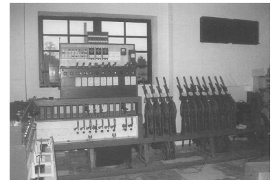
Eines der größten Objekte aus der Sammlung: An diesem mechanischen Stellwerk wurden bis 1995 noch Eisenbahnerausgebildet. Nach der Wiederherstellung der Funktionsfähigkeit sollen an ihm die technischen Bedingungen des Signal- und Sicherungswesens erläutert werden.