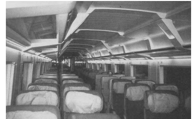
Mitte September präsentierte die Deutsche Bahn AG die neue Zuggeneration, den ICE 2. Die Neuanschaffung ermöglichte u.a. die Verdichtung des ICE-Angebotes zwischen Berlin und Frankfurt am Main auf einen Stundentakt.