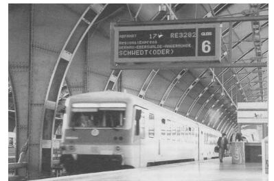
Berlin Hauptbahnhof. Anstatt eine derzeit unsinnige neuerliche Umbenennungsdebatte loszutreten, sollte sich die Berliner CDU besser dafür einsetzen, daß hier nicht nur Regionalzüge verkehren, sondern auch möglichst viele der in Berlin-Lichtenberg endenden Fernzüge.