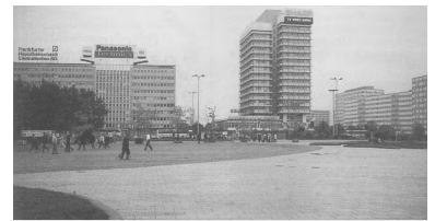
Aus der ehemaligen Neuen Königstraße (Bildmitte) soll die Straßenbahn geradlinig über den Alexanderplatz geführt werden.