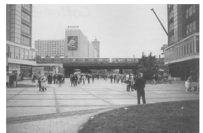
Nach dem Willen der Berliner Abgeordneten wird man ab 1998 am Alex wieder von der Straßenbahn in die dort verkehrenden fünf S- und drei U-Bahn-Linien umsteigen können. Zehntausenden von Fahrgästen wird dies täglich die bisher erforderlichen Umwegfahrten ersparen.