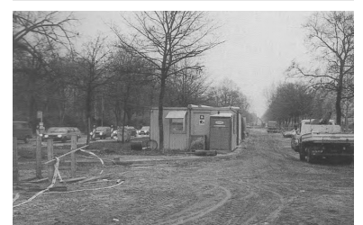
Blick vom gleichnamigen U-Bf in die Seestraße nach Westen (links) und Osten. Auch die schönsten Fahrzeuge auf der InnoTrans