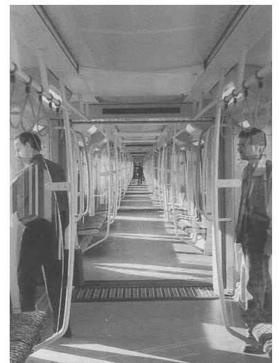
Umstritten. Der neue Berliner U-Bahn-Zug Typ H mit sechs durchquerbaren Wagen und ausschließlichen Längssitzen.