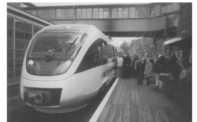
Der Talent; von Bombardier/Talbot am Regionalbahnsteig in Westkreuz. Die DB AG setzte während der InnoTrans klare Prioritäten: Weil zwischen dem Güterbf Wilmersdorf und dem Bf Westkreuz jeweils zwischen etwa 11 Uhr und 16 Uhr neue Nahverkehrsfahrzeuge vorgeführt wurden, hatten die Fahrgäste der Regionalbahn-Linien 12 und 18 das Nachsehen. Ihre Züge wurden entweder zum Bf Charlottenburg umgeleitet oder setzten erst am Bf Spandau ein.