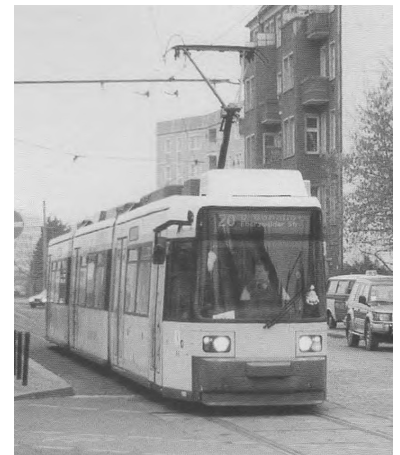
Beschleunigung der BVG-Linie 20: Vom Pilotprojekt zum Flop. (Foto: Marc Heller)

Die BVG wollte die für Umbau- und Programmierung erforderlichen Kosten von ca. 50 Mio DM sogar vorfinanzieren, wenn damit der langfristige Bestand der neuen