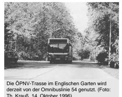
Die ÖPNV-Trasse im Englischen Garten wird derzeit von der Omnibuslinie 54 genutzt. (Foto: Th. Krauß, 14. Oktober 1996)