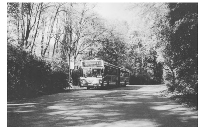
ÖPNV-Trasse. (Foto: Th. Krauß, 14. Oktober 1996)