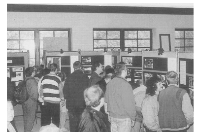
Die Ausstellungstafeln zur Berliner S-Bahn im Jahre 1945 fanden viele interessierte und nachdenkliche Betrachter.