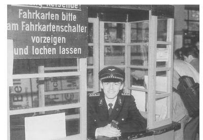
Ihre Karte, bitte! Wie früher die Fahrkarten, so wurden beim Tag der offenen Tür die Eintrittskarten geknipst.