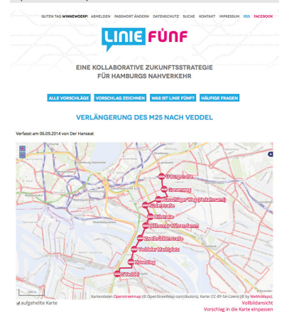
Screenshots der Beitragsübersicht und eines Linienvorschlags für Hamburg. (liniefuenf.de)