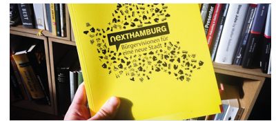
Titelseite Nexthamburg-Buch

Einen besonderen Schwerpunkt bildete hier das Thema Verkehr. Für den Hamburger