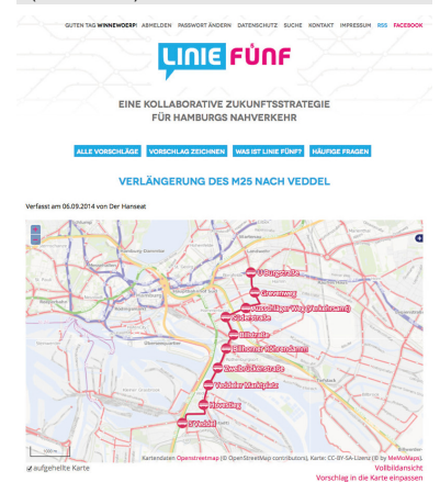
Screenshots der Beitragsübersicht und eines Linienvorschlags für Hamburg.