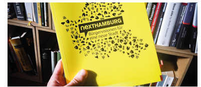
Titelseite Nexthamburg-Buch

Einen besonderen Schwerpunkt bildete hier das Thema Verkehr. Für den Hamburger