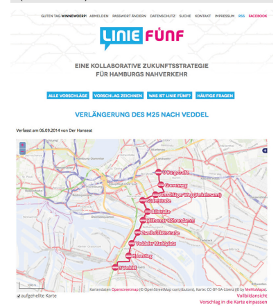
Screenshots der Beitragsübersicht und eines Linienvorschlags für Hamburg. (liniefuenf.de)