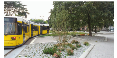
Der Umbau des Helsingforser Platzes vom Verkehrs- zum Stadtplatz ist gelungen. Die Straßenbahnschleife wurde gekonnt integriert und ist dank taktlicher Platten und abweichendem Bodenbelag trotzdem auffällig genug, um nicht übersehen zu werden.

Die neue 347er-Linienführung ermöglicht nun den lange geplanten Umbau der Warschauer Straße zwischen dem gleichnamigen S-Bahnhof und dem Frankfurter Tor.