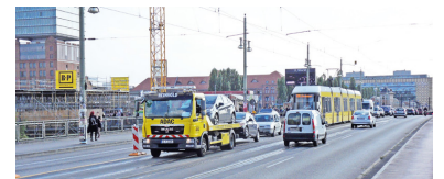
Der sinnvolle Umbau der Warschauer Straße hat begonnen. Doch in der 1. Bauphase liegt die Einengung auf eine Fahrspur ungünstig mitten auf der Warschauer Brücke, statt bereits am U-Bahnhof. Folge: Die Straßenbahnen der Linie M 10 brauchen nicht mehr eine Minute über die Brücke, sondern stehen im Durchschnitt etwa 5 Minuten im Stau!