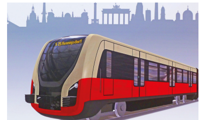
Designstudie von Bombardier auf der Innotrans 2012. Bombardier ist bisher der einzige Fahrzeughersteller, der einen Designvorschlag veröffentlicht und die Anforderungen an die neue S-Bahn mit Fahrgästen diskutiert hat. (Zeichnung: Bombardier)

Die Fahrzeuge müssen auch mit dauerhaft ausgeschalteter Kühlung/Entfeuchtung (z. B. bei Defekt) im Fahrgastbetrieb einsetzbar sein. Für eine ersatzweise Lüftung bei warmem Wetter müssen Klappfenster als zweite reguläre und optimierte Technik zur Verfügung stehen. Jedes zweite Fenster ist als Klappfenster auszuführen, das sorgt für eine Verteilung der Klappfenster über die ganze Wagenlänge. In jedem »Abteil« (zwischen zwei Türen pro Seite) sollte pro Seite ein Klappfenster sein. Im Funktionsfall der Klimaanlage sind diese Klappfenster verriegelt und können nur