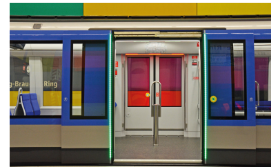
Im neuen U-Bahn-Zug für München der Firma Siemens sind Leuchtbänder an den Türkanten angebracht. Diese leuchten grün, wenn die Türen freigegeben sind und rot, sobald die Türfreigabe zurückgezogen wird. Damit soll die Erkennbarkeit des Öffnungs- und Schließvorgangs verbessert werden. Eine beispielhafte Idee.