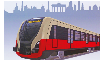
Designstudie von Bombardier auf der Innotrans 2012. Bombardier ist bisher der einzige Fahrzeughersteller, der einen Designvorschlag veröffentlicht und die Anforderungen an die neue S-Bahn mit Fahrgästen diskutiert hat. (Zeichnung: Bombardier, Foto: Raul Stoll)

Die Fahrzeuge müssen auch mit dauerhaft ausgeschalteter Kühlung/Entfeuchtung (z. B. bei Defekt) im Fahrgastbetrieb einsetzbar sein. Für eine ersatzweise Lüftung bei warmem Wetter müssen Klappfenster als zweite reguläre und optimierte Technik zur Verfügung stehen. Jedes zweite Fenster ist als Klappfenster auszuführen, das sorgt für eine Verteilung der Klappfenster über die ganze Wagenlänge. In jedem »Abteil« (zwischen zwei Türen pro Seite) sollte pro Seite ein Klappfenster sein. Im Funktionsfall der Klimaanlage sind diese Klappfenster verriegelt und können nur