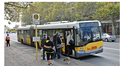
Bus 156 am S-Bf Landsberger Allee. Die Haltestelle ist als Station im Tarifbereich B gekennzeichnet. Aber im BVG-Stadtplan ist die Grenze so um die Haltestelle herum gezeichnet, als ob sie in Zone A läge