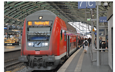
Regionalexpress von Berlin nach Magdeburg. Wer eine Fahrradkarte für das VBB-Gebiet besitzt und nach Sachsen-Anhalt reist, wo die Fahrradmitnahme im Regionalverkehr kostenlos ist, muss dennoch einen Anschlussfahrchein lösen, weil der Fahrausweis immer nur bis zur letzten Station im VBB-Tarifgebiet und nicht bis zur VBB-Tarifgebietsgrenze gilt.

Wer im Besitz eines Potsdamer AB-Tickets ist und nach Berlin fahren möchte, muss einen Teil der Strecke doppelt bezahlen. Um zum ersten Bahnhof im Berliner B-Bereich zu gelangen, benötigt man zusätzlich zum Potsdamer Ticket ein Berliner BC- oder ABC-Ticket, obwohl man für Berlin C ja schon das Potsdamer AB-Ticket