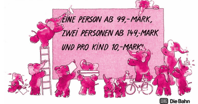
Die Bundesbahn warb 1985 mit rosa Elefanten für Sparpreise. (Abb.: Bundesbahn)