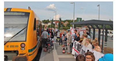
Seit November 2013 findet jeden letzten Freitag im Monat die Aktion »Rote Laterne« an allen Bahnhöfen der Südbahnlinie R 3 zwischen Hagenow Stadt und Neustrelitz statt. Auch hier am Malchower Bahnsteig sagen Bürger »NEIN« zur Politik des Infrastrukturministeriums und zum Ende der Bahn nach Parchim.