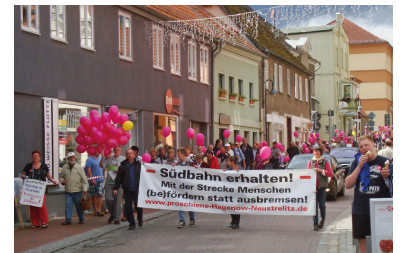
Demonstration in Inselstadt Malchow am 24. August 2014: Mit einer Menschenkette zwischen Bahnhof und Altstadt-Drehbrücke machen etwa 300 Menschen auf die drohende Schließung der Südbahn aufmerksam. Sie fordern den Erhalt der Bahnlinie R 3 als Landbrücke der Kreise Ludwigslust-Parchim und Mecklenburgische Seenplatte mit schnellem Anschluss an die Oberzentren Schwerin und Rostock sowie an die Metropolen Berlin und Hamburg. Gerade in Südmecklenburg brauchen Menschen für die grundgesetzlich verankerten gleichwertigen Lebensverhältnisse verlässliche und nicht »flexible« Mobilität.

Den von der BI angemeldeten Zweifeln an den offiziellen Begründungen haben Infrastrukturminister Christian Pegel und sein Abteilungsleiter Rainer Kosmider eine Absage erteilt. Sie weigerten sich sogar, alternative Konzepte ernsthaft zu prüfen, die eine Einbindung von Plau am See vorsahen und die Potenziale der Südbahn berücksichtigten. Doch nicht nur das: Sie haben den Dialog mit den betroffenen Kommunen und den Bürgern einseitig aufgekündigt. Sie sind taub für Kritik an ihren folgenschweren Entscheidungen und lassen nun die Landkreise Ludwigslust-Parchim (LUP) und Mecklenburgische Seenplatte (MSE) das »flexible« Busersatzkonzept planen. Das sieht so aus: Während die R 3-Züge von Parchim nach Malchow derzeit