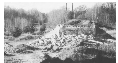
Kremmener Bahn, Blick Richtung Hennigsdorf. Das Foto zeigt den unterbrochenen Bahndamm im Bereich des ehemaligen Mauerstreifens.