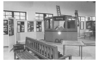
Blickfang in der Mitte des Berliner S-Bahn-Museums ist der Nachbau einer Fahrzeugfront der legendären Baureihe 165.

Die Fotos von Michael Klinec sind Momentaufnahmen aus dem Alltag der Berliner S-Bahn. Gleich, ob sie zwei oder zwanzig Jahre alt sind, alle Bilder vermitteln eine wunderbare Stimmung aus Farbe, Licht und Schatten. Sie zeigen die S-Bahn in der