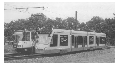
Im Juli/August wurde der Prototyp des „Combino“ durch Einsatz im Potsdamer Regelverkehr intensiv getestet. Das heftig umstrittene Fahrzeug überzeugte hierbei sowohl technisch wie auch hinsichtlich der Fahrgastanforderungen.