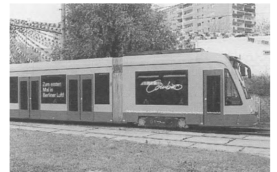
Erste Präsentation des „Combino“ im Herbst 1996, hier in Berlin-Marzahn.

Geradezu anziehend wirkt die erste Tür des Wagens. Ausgerechnet diese ist aber nur