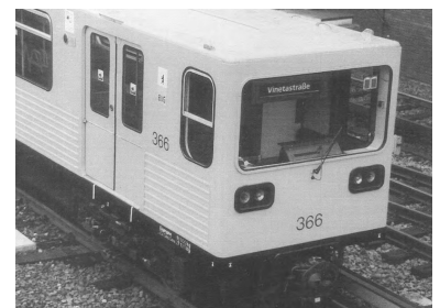
Die BVG baut jetzt auch die ihr verbliebenen G1/1-U-Bahn-Züge (Gisela) für Fahrerelbstabfertigung um und wird sie noch viele Jahre einsetzen. Ursprünglich wollte man sich bei der BVG (West) von den Ost-Zügen schnellstmöglich vollständig trennen.