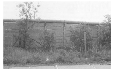
Unterbrochene Bahnstrecke nach Falkensee 1976. Die Hamburger Bahn durch die Berliner Mauer unterbrochen. Der Fernverkehr wurde über Wannsee bzw. ab 1976 über Staaken geführt. Der letzte Zug verkehrte am 5.12.1961, als ein Personenzug aus Oranienburg nach Albrechtshof hier die Grenze durchbrach. Die S-Bahn verkehrte bis zum 13.8.61 Richtung Falkensee und fehlt heute noch an dieser mittlerweile geschlossenen Eisenbahnücke.