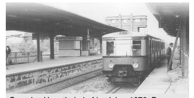
Spandau Hauptbahnhof im Jahre 1976. Der Fernbahnsteig im Bahnhof Berlin-Spandau wurde 1976 als Halt für die Transitzüge Berlin - Hamburg wieder eingerichtet, gleichzeitig wurde der S-Bahnsteig aufgefrischt. Ein neuer Fernbahnhof wurde anstelle des alten Vorortbahnhofs Spandau-West zentral an Rathaus und Altstadt im Mai 97 Teileröffnet. Hier am früheren Spandauer Hauptbahnhof entsteht bis Ende 1998 die S-Bahnstation Stresow.

In vereinfachter Form erfolgten dann 1951 die S-Bahn-Verlängerungen von Spandau West nach Staaken an der Lehrter Bahn (3. August) sowie Falkensee an der Hamburger Bahn (14. August). Damit waren von Westkreuz her, also der Stadtbahn, auch der westliche Stadtrand und das unmittelbare Umland angeschlossen. Außerdem wurde Spandau vom Bahnhof Jungfernheide her angeschlossen. Für den elektrischen S-Bahn-Betrieb eröffnet wurde die Strecke zwischen Jungfernheide und Spandau am 28. August 1951, auch hier konnten jetzt die Dampfzüge entfallen. Die durch die Firma Siemens der Reichsbahn finanzierte »Siemensbahn" von Jungfernheide zum