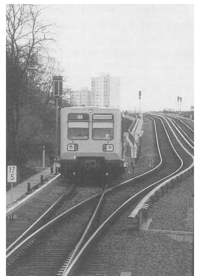
Einfädung S45/S46 in die S4 am S-Bahnhof Neukölln.