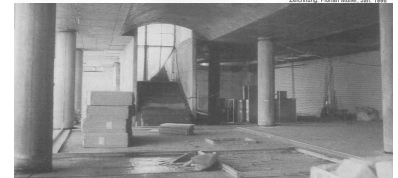
Schmale Treppen zu den Bahnsteigen im neuen Bahnhof Spandau.