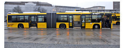
Der neue Gelenkwagen von Scania im neuen BVG-ganz-gelb mit der Klapprampe in der Mitte. Zum Vergleich im Hintergrund ein Doppeldecker noch mit grauer Schürze und weißem Dachband.

http://signalarchiv.de/Meldungen/10003701 .