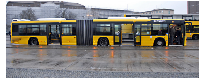
Der neue Gelenkwagen von Scania im neuen BVG-ganz-gelb mit der Klapprampe in der Mitte. Zum Vergleich im Hintergrund ein Doppeldecker noch mit grauer Schürze und weißem Dachband.

http://signalarchiv.de/Meldungen/10003701 .