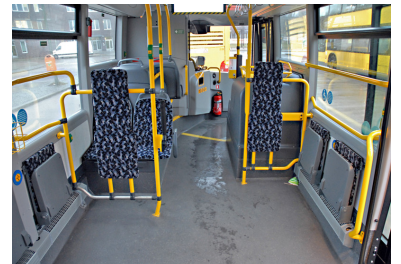
Blick auf die Stellfläche mit den Klappsitzen. Deutlich zu sehen: Die hohen Seitenwände unter den ersten Fenstern und der rechte Radkasten ohne Sitzplatz an der Vordertür.