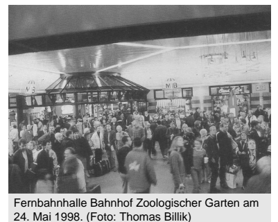
Fernbahnhalle Bahnhof Zoologischer Garten am 24. Mai 1998.