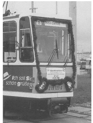
Abschiedszug am 25. Mai 1998.