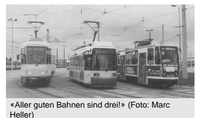
«Aller guten Bahnen sind drei!»