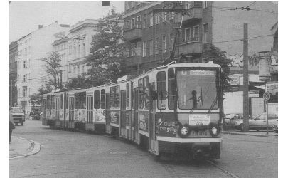
Letzte Einfahrt in die Endhaltestelle Eberswalder Straße.