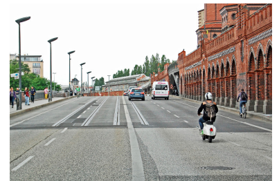
Oberbaumbrücke zwischen Friedrichshain und Kreuzberg: Hier wurden bereits 1994 Schienen für eine künftige Straßenbahnverlängerung von der Endhaltestelle am U-Bahnhof Warschauer Straße Richtung Hermannplatz verlegt. Doch wann diese wichtige Strecke gebaut wird, ist vollkommen ungewiss.