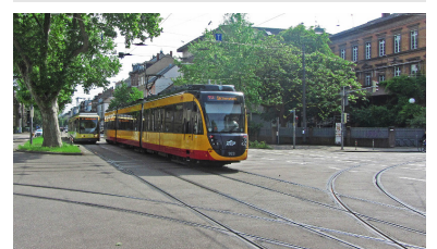
Wenn mal was dazwischen kommt, dann kann die Leitstelle in Karlsruhe sofort Umleitungen anordnen, während die Berliner Straßenbahnen in einem langen Stau auflaufen, weil keine Weichen zum Abbiegen oder Wenden vorhanden sind.