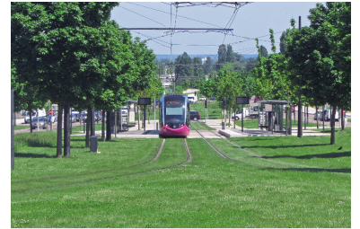
Das ist KEIN Park, sondern der attraktiv gestaltete Mittelstreifen einer vierspurigen Straße im französischen Dijon. Solche Straßenbahn-Strecken rufen auch keine Proteste von Bürgern bei der Planung hervor

In vielen Debatten der jüngeren Zeit wird von Straßenbahngegnern behauptet, neue Trassen verschandeln das Stadtbild. Bezeichnend daran ist, dass das von neuen Autobahnen nicht behauptet wird, obwohl es bei denen wirklich so ist - im Gegensatz zu Tramstrecken, die sich geradezu organisch in bestehende Strukturen einbinden lassen. Ein schönes Beispiel dafür sind Rasengleise in Parkanlagen, die man nahezu unsichtbar ausführen kann. Und als weiterer positiver Effekt wird bei dieser