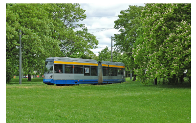
Finden Sie die Schienen? Ein schönes Beispiel für eine naturnahe Trasse in Leipzig. Dazu gehört auch, dass die Oberleitungsmasten nicht das Bild verstellen, sondern trotz Mehrkosten so platziert sind, dass der freie Blick über die Wiese erhalten bleibt.