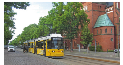
Das Grundprinzip eines überfahrbaren Haltestellenkaps ist hier schön zu sehen: Eine auf Wagenbodenniveau angehobene Fahrbahn, die für Autos weiter benutzbar bleibt (kein Platzverbrauch für Bahnsteige). Leider ist diese erste Ausführung in Berlin-Friedrichshagen durch den trotzdem vorhandenen Bordstein und das Kopfsteinpflaster für die Zielgruppe (Gehbehinderte, Rollstuhl- und Rollatorenutzer) nicht optimal.