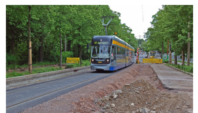
Leipzig. Die Straßenbahn fährt eingleisig an der Baustelle vorbei, während der Autoverkehr umgeleitet wird. Offenbar funktioniert sogar im autofreundlichen Sachsen, was der Berliner Senat scheut.