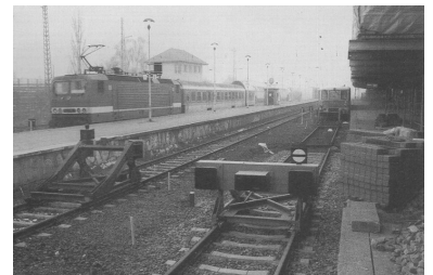
Prellbock im S-Bahn-Gleis im Bahnhof Hennigsdorf. (Foto: Florian Müller, November 1998)