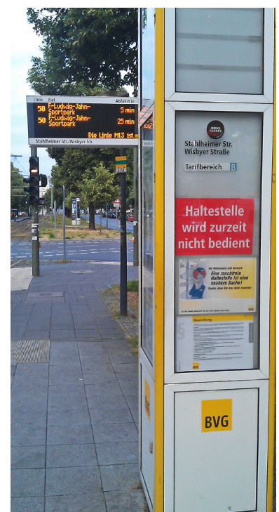
Widersprüchliche Fahrgastinformation! Der Aushang erklärt »Haltestelle wird zurzeit nicht bedient«, während DAISY die nächsten Abfahrten an der Stahlheimer/Wisbyer Straße anzeigt. Grund: Bauarbeiten in der Langhansstraße. Die M 13 endete bereits an der Björnsonstraße - außer bei Aussetzfahrten zum Betriebshof.