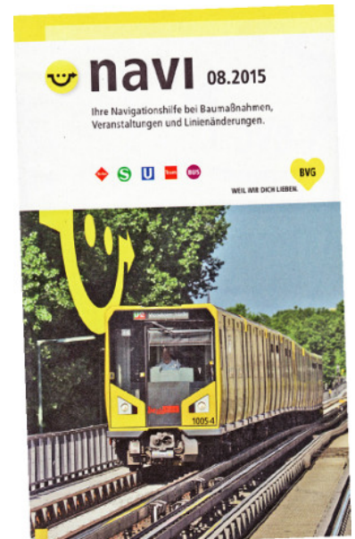
Navi heißt das Heftchen, das der monatlichen BVG-Kundenzeitschrift beigelegt ist.

So war der 10-Minuten-Takt der M 1 nach Rosenthal ein Geheimitipp, denn in der Auskunft endete jede zweite Fahrt bereits an der Haltestelle