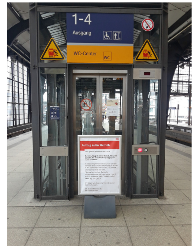
Endstation Treppe!? Damit niemand unverhofft vor dieser Hiobsbotschaft stehen muss, ist eine gute Fahrtenplanung auf der Basis aktueller Fahrgastinformationen über Ausfälle erforderlich. Wo es die gibt, wollen wir hier betrachten.

Der VBB hat die Brokenlifts-Aufstellung nicht nur als übersichtliche