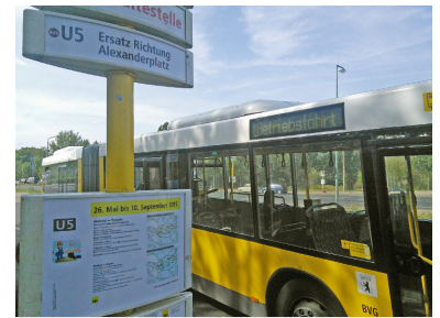
Ab Wuhletal fährt planmäßig jeder zweite Bus als Betriebsfahrt zum Tierpark zurück. Sehr zum Ärger der wartenden Fahrgäste, die dadurch bei Verspätungen auch mal 20 Minuten warten müssen.

Der SEV von Tierpark nach Wuhletal wurde gegenüber 2014 optimiert. Aber nicht etwa aus Fahrgastsicht, sondern betrieblich. Am U-Bahnhof Tierpark startet er alle 5 Minuten. Das reicht für das recht geringe Fahrgastaufkommen auch aus, denn eigentlich nutzt der SEV nur jenen Fahrgästen, die zum Elsterwerdaer Platz wollen. Nach Wuhletal geht es auch von Tierpark aus schneller mit Straßenbahn und S-Bahn über Friedrichsfelde Ost, und die kundigen Direktfahrgäste sind ohnehin gleich am