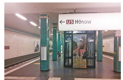
Nicht angepasste Wegeleitung am U-Bahnhof Tierpark. Links geht es nur nach Biesdorf-Süd. Die widersprechenden gelben Bodenaufkleber weisen den Weg zum SEV »Richtung Hönow«. In Wuhletal wurde die Wegeleitung hingegen vorbildlich angepasst.