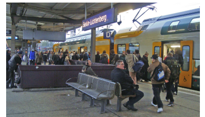
Stets gut angenommen ist anlässlich der Stadtbahnsperre der über Lichtenberg Gesundbrunnen--Jungfernheide umgeleitete RE 2 (29. August bis 12. Dezember 2015). Die damit entstehende Fahrzeit Lichtenberg--Spandau in 25 Minuten ist sonst nur mit dem Hubschrauber zu schaffen. Die S-Bahn braucht dafür 48 Minuten. Auch künftig sollte diese Verbindung dauerhaft angeboten werden, z. B. mit dem RE 6 oder der RB 10.

Bei den Linien RE 3 und RE 5 werden die Südäste getauscht, so dass die Linie RE 3 künftig von Stralsund nach Falkenberg bzw. von Schwedt nach Lutherstadt Wittenberg