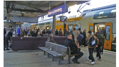
Stets gut angenommen ist anlässlich der Stadtbahnspernung der über Lichtenberg Gesundbrunnen--Jungfernhöhe umgeleitete RE 2 (29. August bis 12. Dezember 2015). Die damit entstehende Fahrzeit Lichtenberg--Spandau in 25 Minuten ist sonst nur mit dem Hubschrauber zu schaffen. Die S-Bahn braucht dafür 48 Minuten. Auch künftig sollte diese Verbindung dauerhaft angeboten werden, z. B. mit dem RE 6 oder der RB 10.

Bei den Linien RE 3 und RE 5 werden die Südäste getauscht, so dass die Linie RE 3 künftig von Stralsund nach Falkenberg bzw. von Schwedt nach Lutherstadt Wittenberg