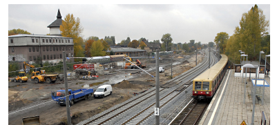
S-Bahnhof Betriebsbahnhof Schöneweide. Die beiden Personen- und Güterverkehrsgleise der Görlitzer Bahn wurden an die S-Bahn herangerückt, um das ehemalige Bahngelände bebauen zu können. Ab 13. Dezember wird hier die RB 24 von Eberswalde über Berlin Ostkreuz nach Senftenberg verkehren.