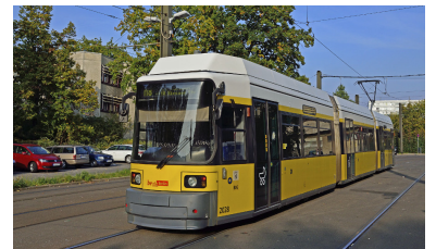
Linie M 8 . Gleich auf mehreren Straßenbahnlinien hat die BVG ihr Fahrplanangebot kürzen müssen, weil sie seit vielen Monaten nicht genügend Fahrer hat. Erst für 2016 verspricht sie eine allmähliche Rückkehr zum Regelfahrplan.

Geht man von der Lohnsteuerklasse 1 aus, ergibt das ein Netto von ca. 1500 Euro im Monat - bei einer 39-Stunden-Woche in Wechselschicht nicht gerade ansprechend. Vergleicht man das mit dem Gehalt einer Verkäuferin, die nach Tarif bezahlt wird, so ist der Unterschied gering. Bei einem Bruttogehalt von ca. 1680 Euro kommt diese auf