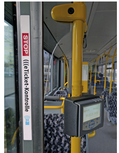
Hier wird angezeigt, dass jetzt jeder seine VBB-Fahrcard an die Lese-/Schreibgeräte halten soll. Wer der Aufforderung folgt, geht ein hohes Risiko ein, sich der Lächerlichkeit preiszugeben. Den Verkehr hält man in jedem Fall auf.

Ganz anders sieht das in den Bussen der BVG aus. »ACHTUNG, KONTROLLE!« steht da jetzt groß an den vorderen Einstiegstüren dran. Auf der linken Seite gegenüber des Fahrers ist ein kleiner Kasten angebracht. An dieses Kontrollgerät soll der Kunde nun immer seine elektronische Fahrkarte halten. Das Gerät soll dann grün leuchten und alles ist paletti. Soweit die Theorie.