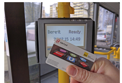
Halten Sie die Karte ans Lesegerät und es passiert nichts. Meistens jedenfalls. Doch die Alternativen sind zum Teil noch unschöner.