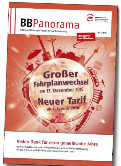
Titelseite des letzten BB-Panorama-Heftes. Man soll ja aufhören, wenns am schönsten ist. Aber gilt das auch für die Fahrgastinformation?!

Zum Fahrplanwechsel im Dezember sollte die Regionalbahnlinie RB 24 von Ostkreuz