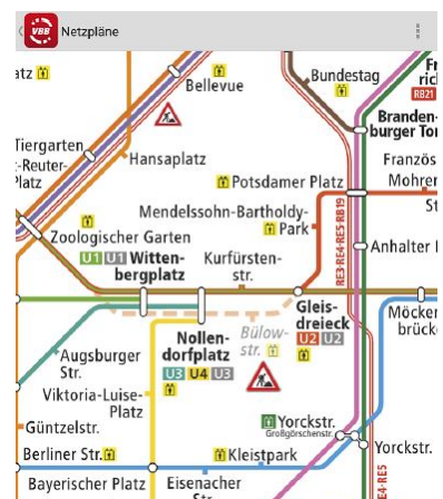
Zeitnahe Austausch in den elektronischen Medien? Fehlanzeige! Nicht nur auf der Webseite, sondern auch in der eigenen App bietet der VBB Liniennetze mit seit Monaten veraltetem Stand an. Die U 12 fährt schon eine ganze Weile nicht mehr, dafür die U 2 wieder durch. Informationen auf dem App-Stellgleis. (Grafik: VBB)